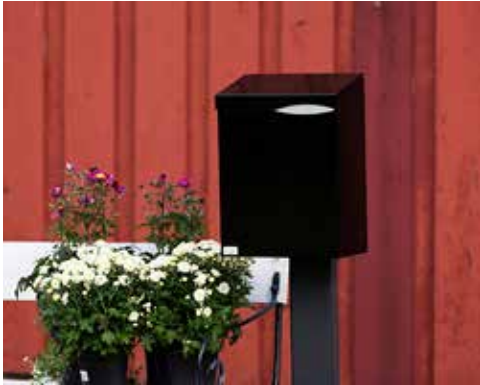
Villa Formfin med lås i topp:

Låsen sitter godt beskyttet under topplokket. Innkast og uttak av brev skjer fra toppen av postkassen. Postkassen tar imot brevpost inntil brevlukens størrelse. Låsen må stenges før nøkkelen kan fjernes.