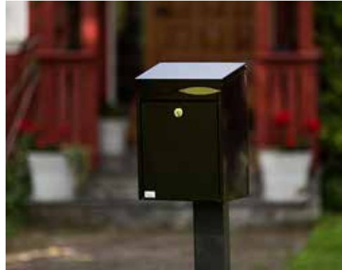
Villa Formfin med lås i front:

Låsen sitter godt beskyttet under topplokket. Innkast og uttak av brev skjer fra toppen av postkassen. Postkassen tar imot brevpost inntil brevlukens størrelse. Låsen må stenges før nøkkelen kan fjernes.